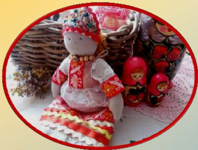
Выставка «С почётом к старине»