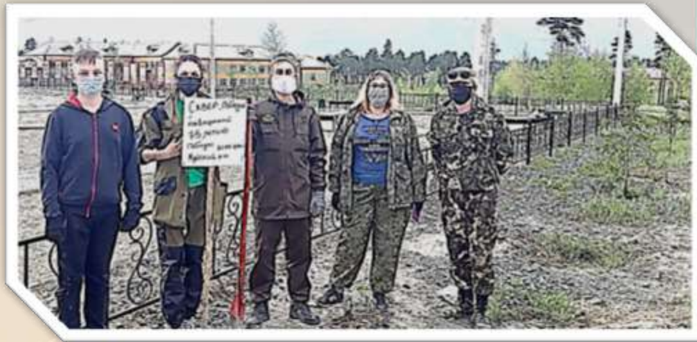
Республиканская акция «Скверы победы»