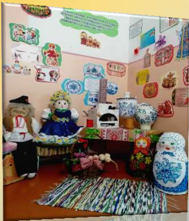
Мини-музей «Русская изба»