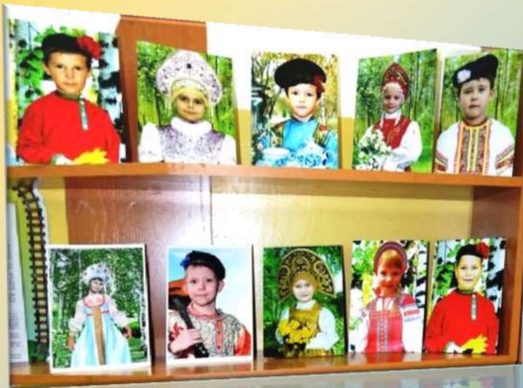
Фотовыставка «Красны девицы и добры молодцы»