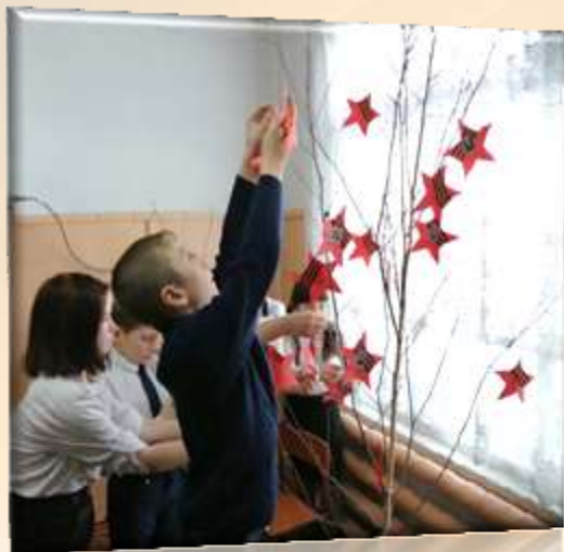
Всероссийская акция «Дерево памяти»