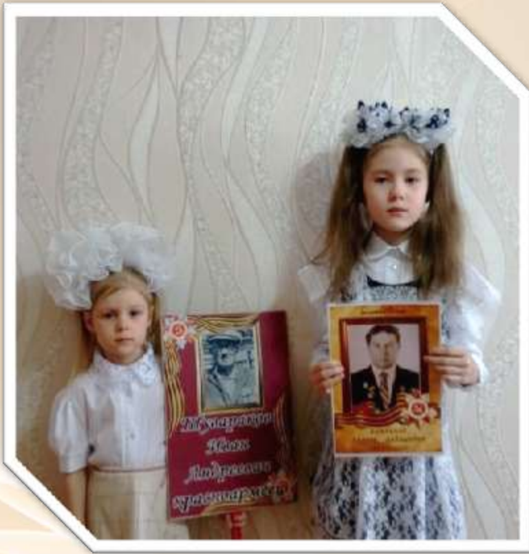
Всероссийская акция «Бессмертный полк»