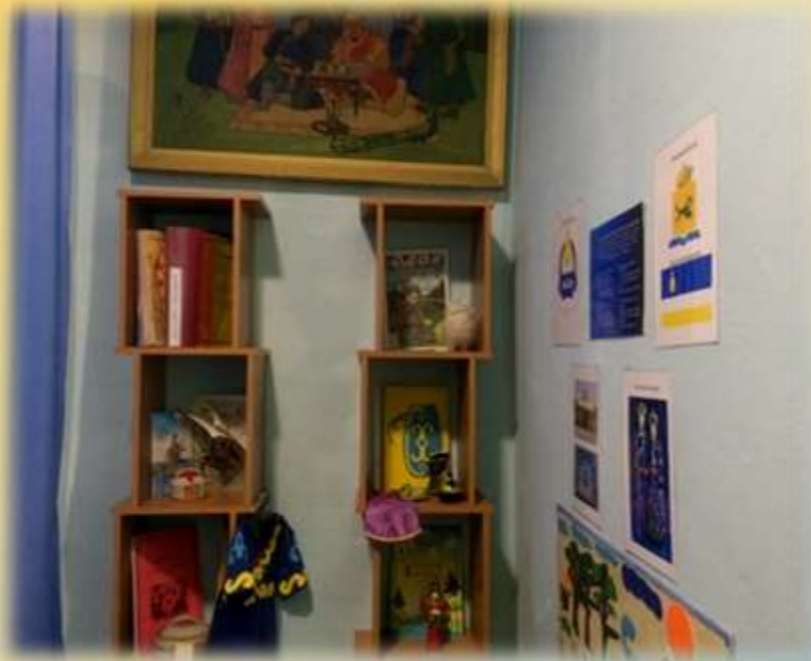
Музей «Родная Бурятия»

Изучение традиций народов, населяющих Республику Бурятия, важное направление воспитательной работы учреждения