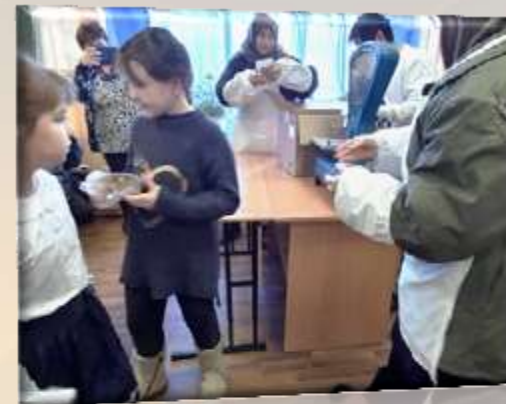
Всероссийская акция «Блокадный хлеб»