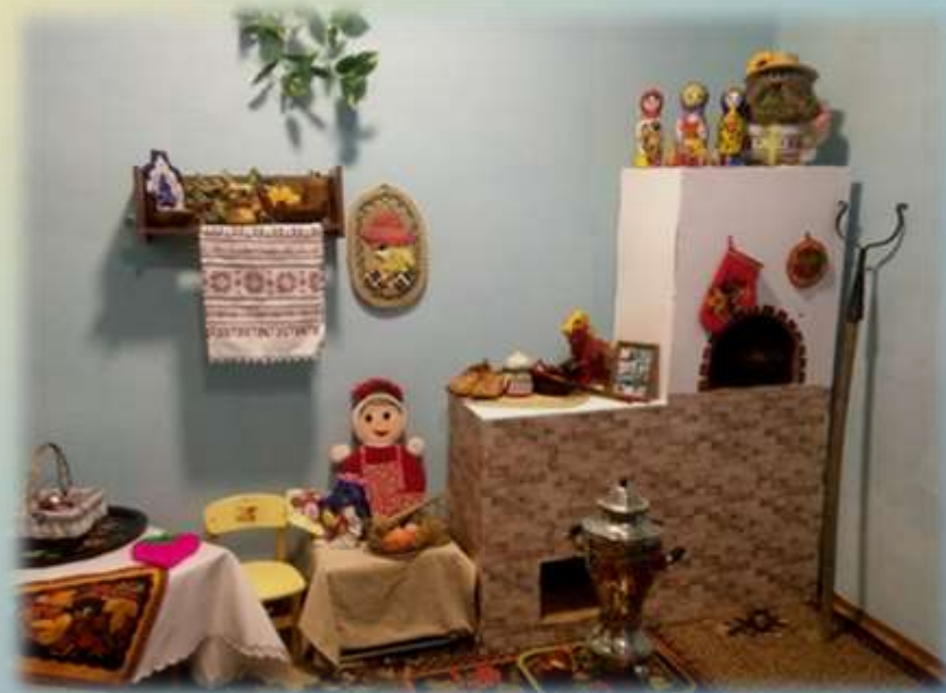
Музей «Русская изба»